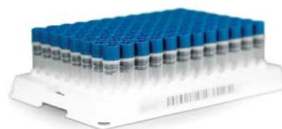
1回分ずつ分注されたチューブが96本入っています