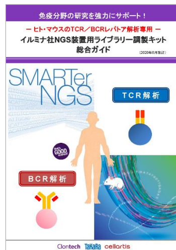
- ヒト・マウスのTCR/BCRレパトア解析専用 - イルミナ社NGS装置用ライブラリー調製キット 総合ガイド