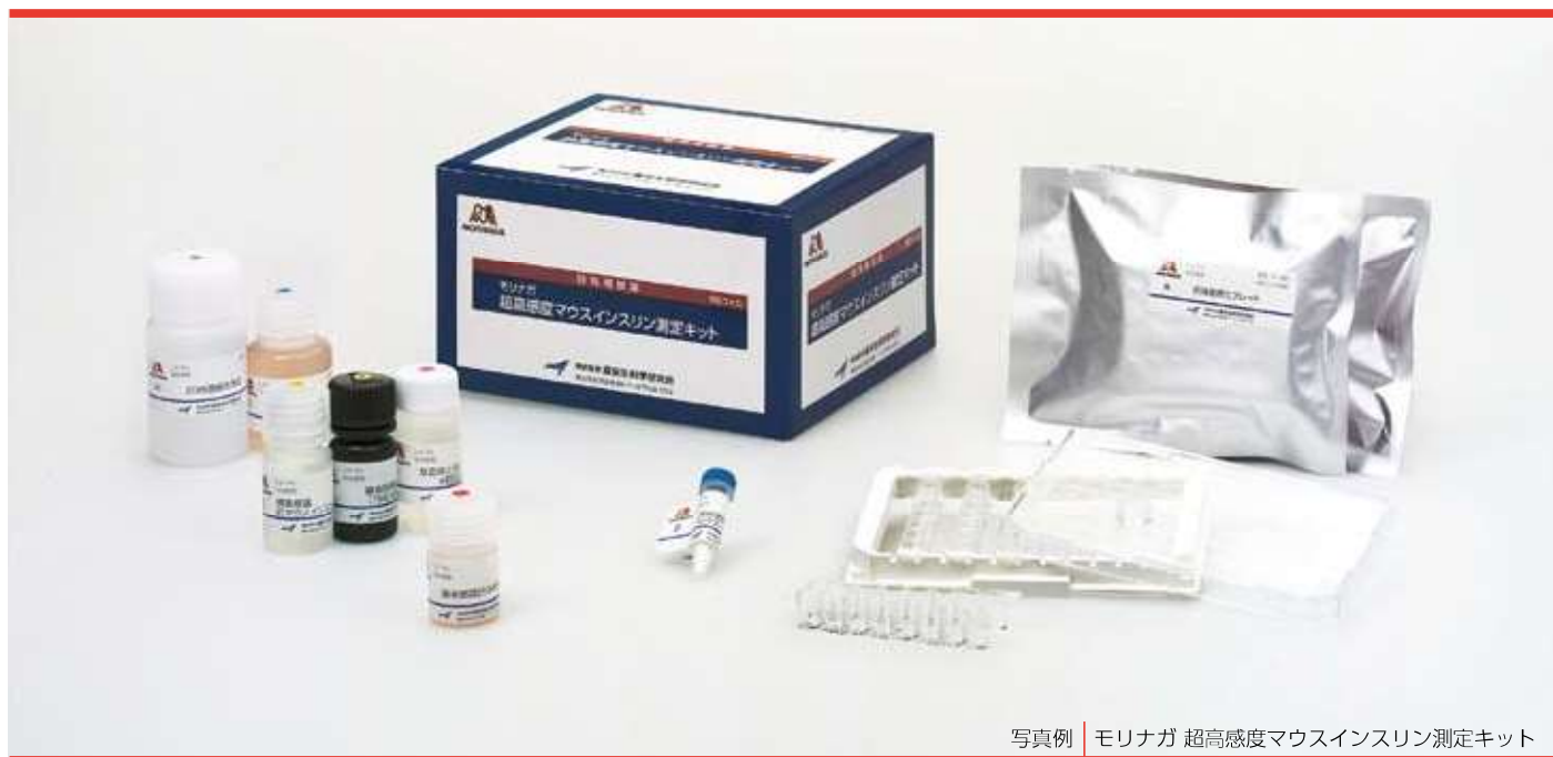
写真例 | モリナガ 超高感度マウスインスリン測定キット